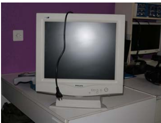
Entrées DVI & VGA