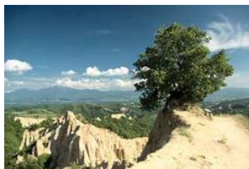
UNICA 2012 RUSE, Bulgarie